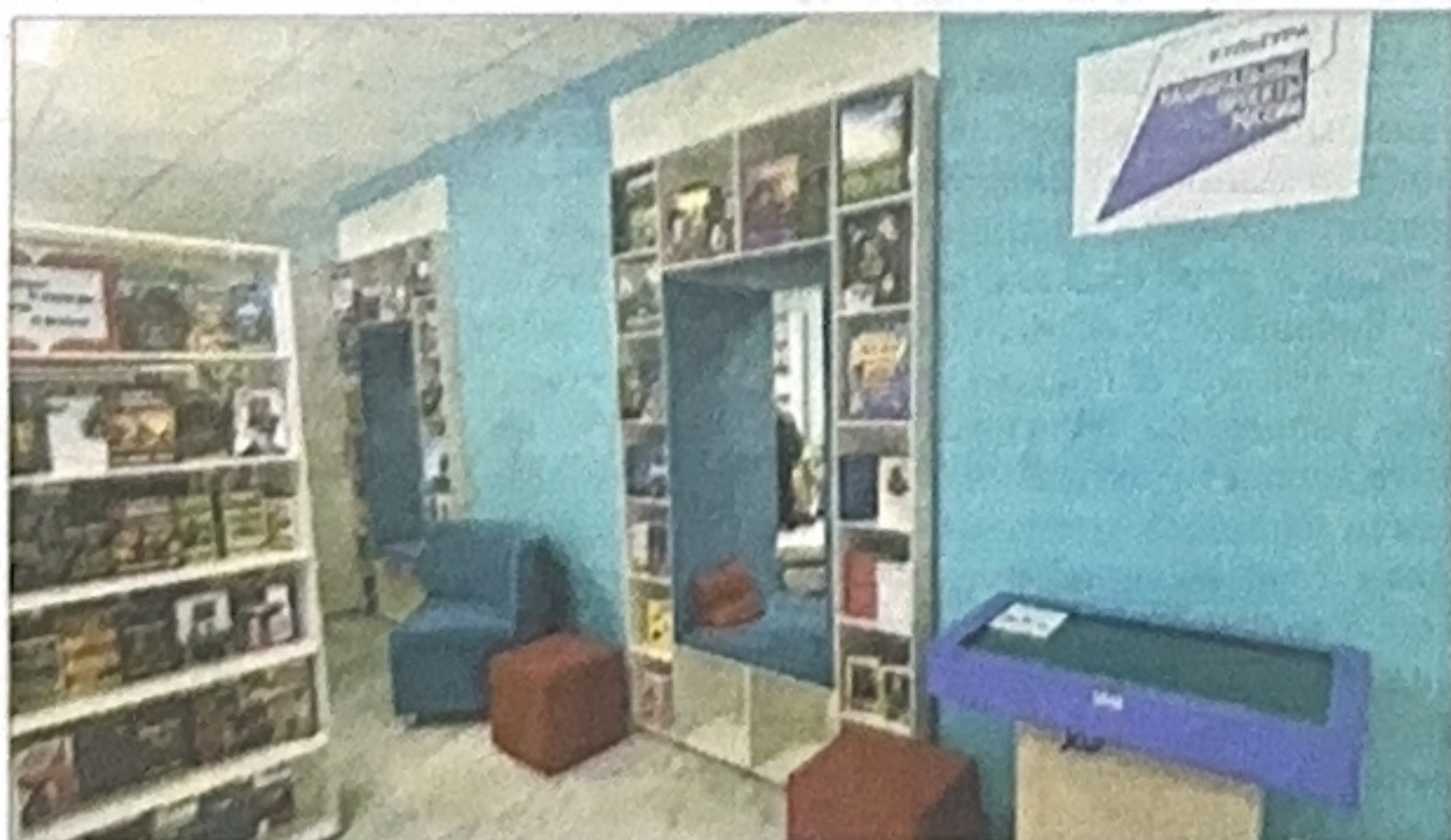
МИНИСТЕРСТВО КУЛЬТУРЫ ЛНР