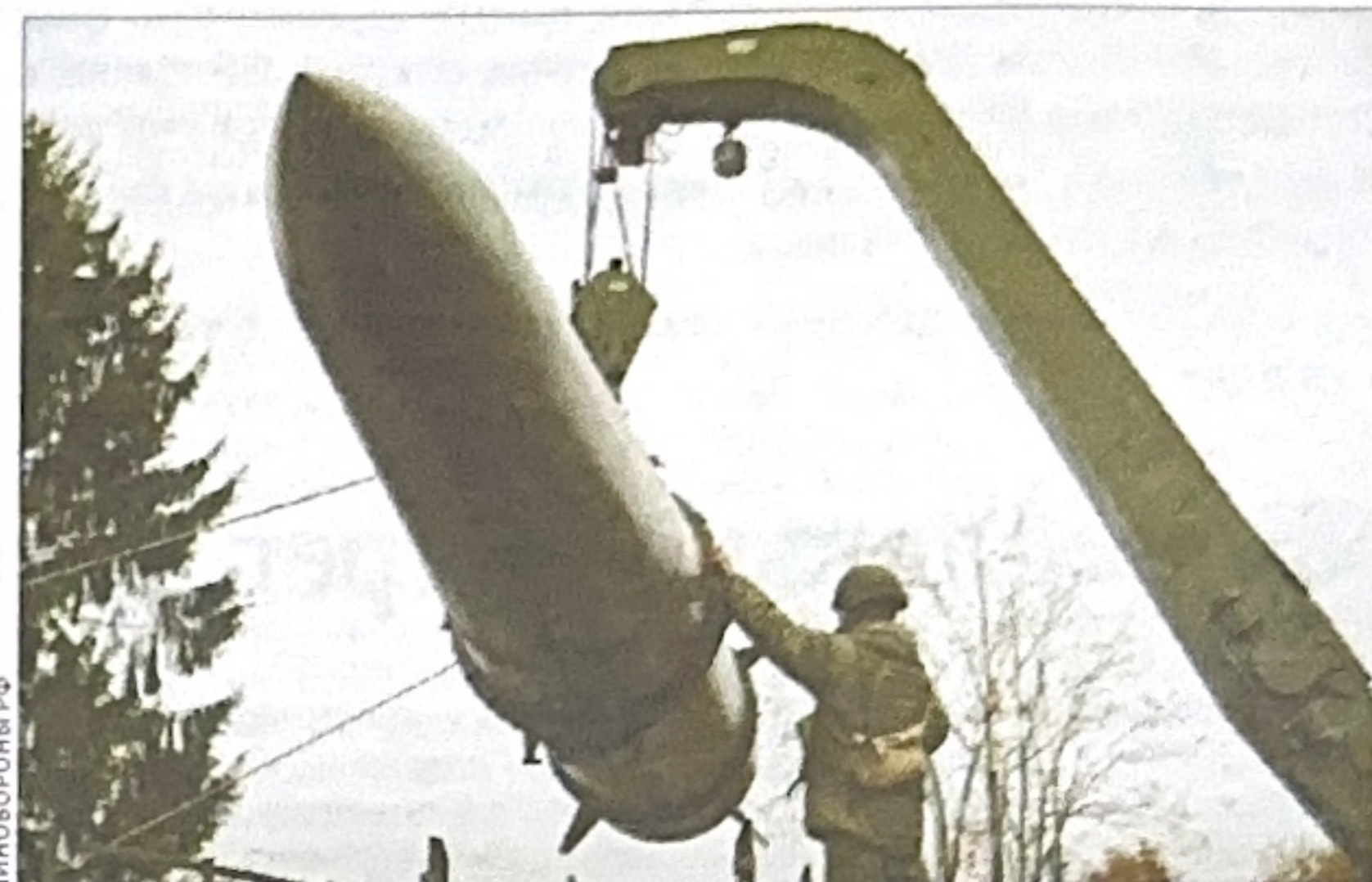
Всего с начала проведения специальной военной операции уничтожены:

Всего за время боевых действий на Курском направлении противник потерял: до 74 450 военнослужащих, 407 танков, 333 боевые машины пехоты, 304 бронетранспортера, 2270