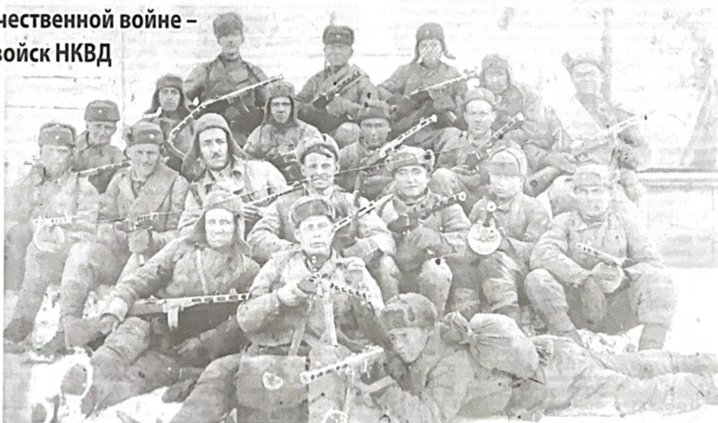
■ Взвод автоматчиков 145-го стрелкового полка войск НКВД. 1945 год.

Командиры и политработники откомандировывались на руководящие