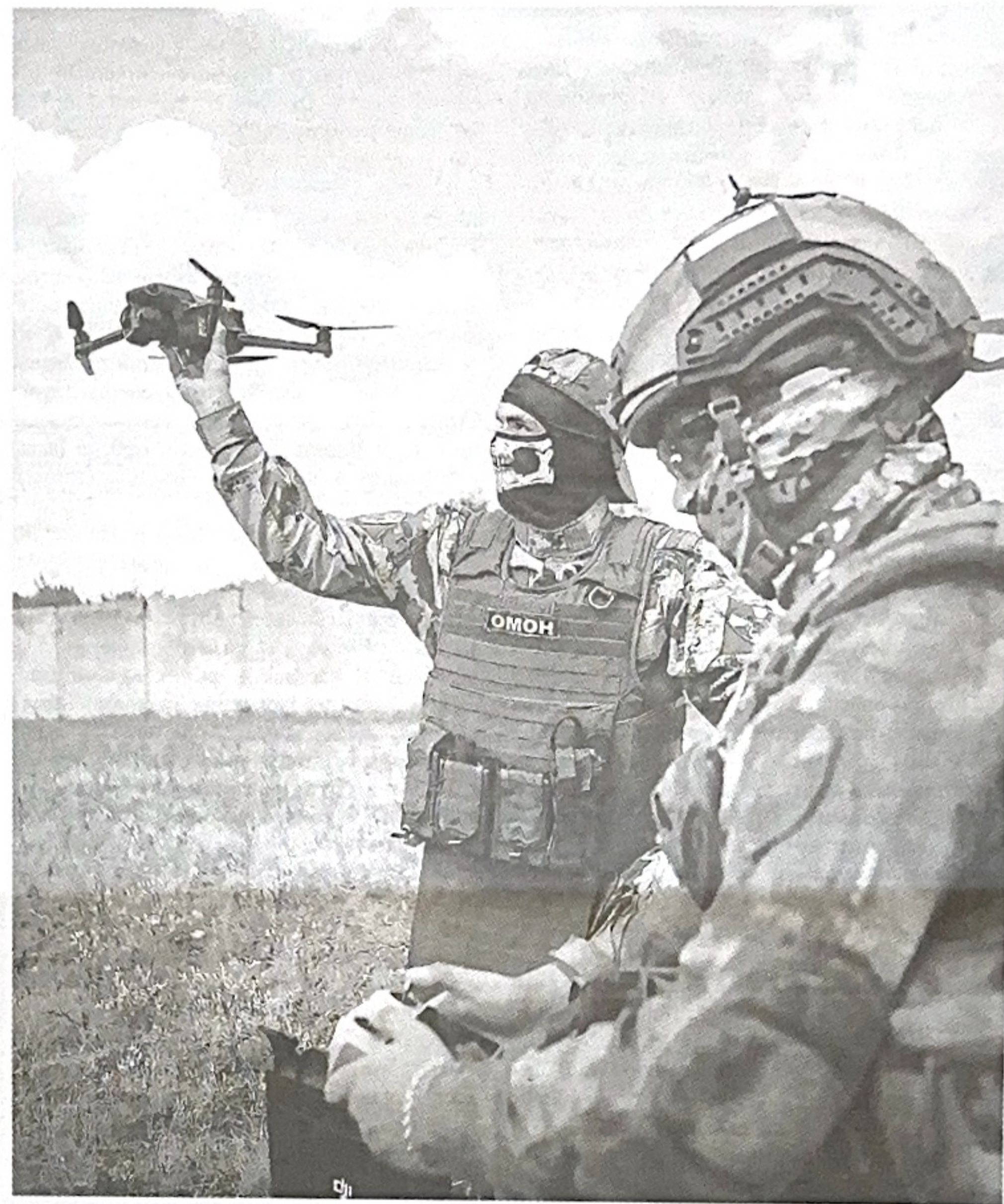
■ Росгвардия всегда на страже