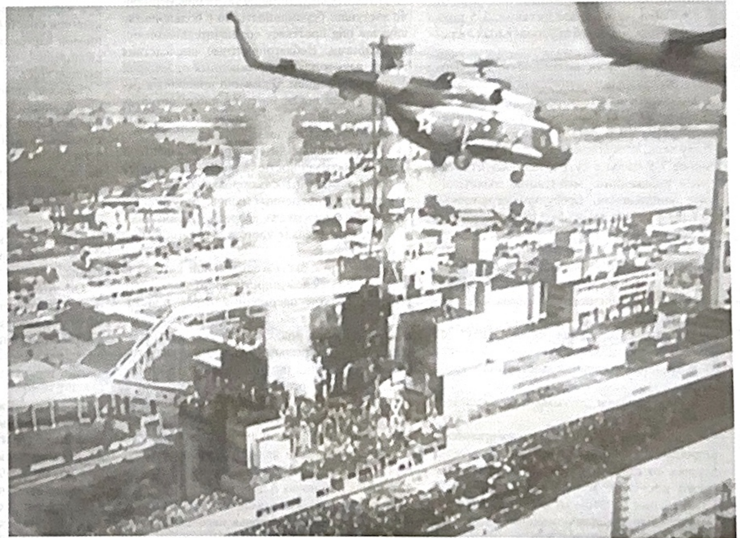
■ Вертолеты Ми-8 авиационного звена особого назначения внутренних войск над Чернобыльской АЭС.

Особая страница в служебно-боевой деятельности внутренних войск связана с аварией на Чернобыльской АЭС в апреле 1986 г. Участие военнослужащих внутренних войск в ликвидации последствий аварии и охране зоны отчуждения Чернобыльской АЭС во многом способство-